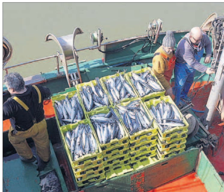
Descarga de caballa en el Cantábrico.

No hay nada decidido sobre el sistema de distribución de cuotas de jurel y caballa para el próximo año en el caladero del Cantábrico Noroeste para las flotas de cerco y artes menores sino aún solo reuniones entre la Secretaría General de Pesca y el sector afectado y sus respectivas comunidades. Sin embargo, por lo que respecta a la flota gallega, algunas alarmas empiezan a encenderse. En concreto, la activada por la posibilidad de que se aplique el ya propuesto criterio de capturas históricas como referencia para la distribución de las posibilidades de pesca. Así, sin querer aún "levantar la voz" porque nada está cerrado, algunas fuentes del sector consultadas por este diario ya avanzan que "el problema puede ser serio porque no sería justo para Galicia". Y, en su argumentación, señalan que "Galicia, con un 56% de la flota del Cantábrico Noroeste, podría quedarse con un 20% del cupo y eso no es justo" por lo que apuestan por atender otros criterios, como la propia realidad de las flotas y sus deri-