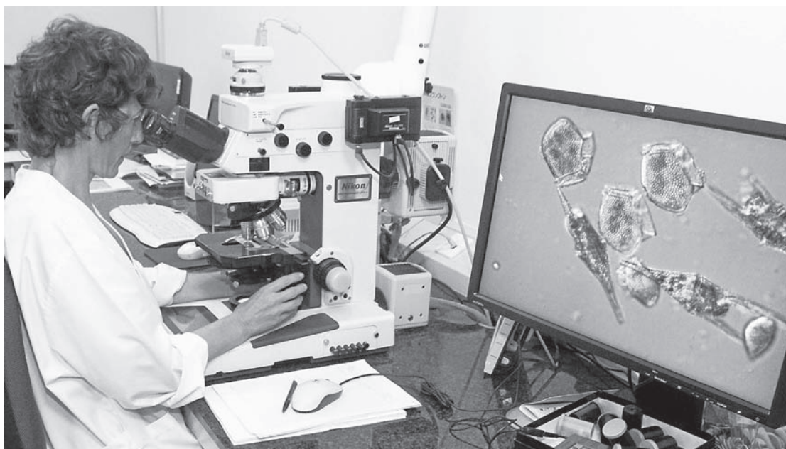
Una técnica del Intecmar analiza las muestras tomadas ayer en distintos puntos de las rías